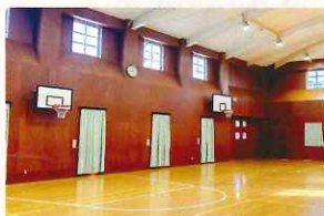
多目的室 定員 100名