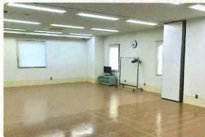
研修室 定員 40名