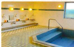
共同浴室 定員 30名