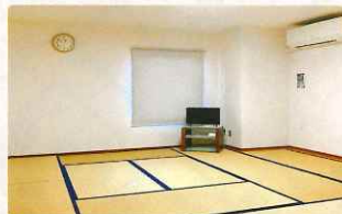
和室 定員 12名 （宿泊時は6名）