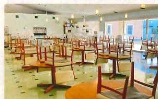
食堂 定員 100名