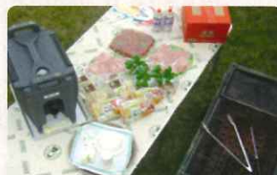
中庭 ※野外調理もお楽しみいただけます